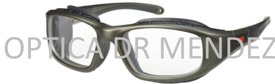
Color en foto: Gris Mate