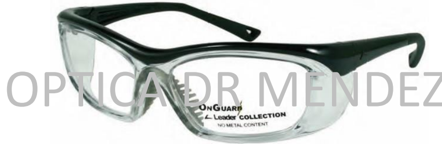
Color en foto: Negro/Transparente