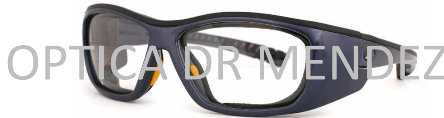
Color en foto: Modelo T3 Azul/Negro