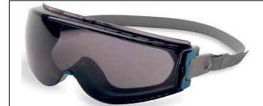
Cuerpo Gris/lente transparente