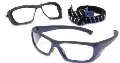
Modelo T1Azul/ Negro