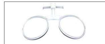
Carrier para lente formulado